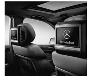
Fond-Entertainment inklusive zwei 20,3 cm Displays