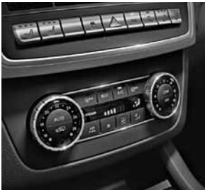
Klimatisierungsautomatik THERMOTRONIC mit 3 Zonen