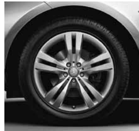
48,3 cm (19") Leichtmetallrädern im 5-Doppelspeichen-Design (R55)