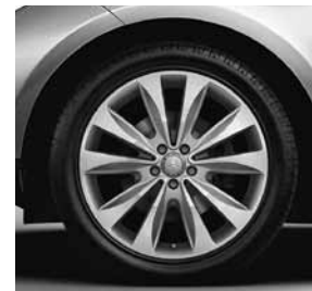
50,8 cm (20") Leichtmetallrädern im 10-Speichen-Design (50R)