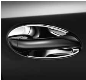
Türgriffschalen, Hochglanz verchromt