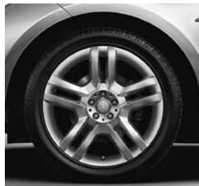
50,8 cm (20") Leichtmetallrädern im 5-Doppelspeichen-Design (R33)