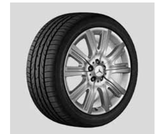
19" Zubehör-Rad, 5-Doppelspeichen-Design