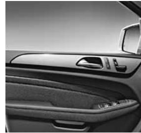
Zierelemente Aluminium mit Längsschliff hell