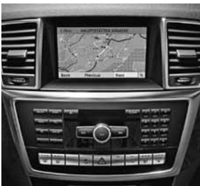
COMAND Online inkl. Geschwindigkeitslimit-Assistent