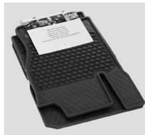
Allwettermatten CLASSIC, Satz 4-teilig