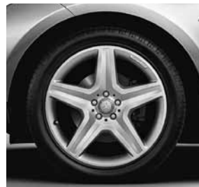
50,8 cm (20") AMG Leichtmetallrädern im 5-Speichen-Design (758)