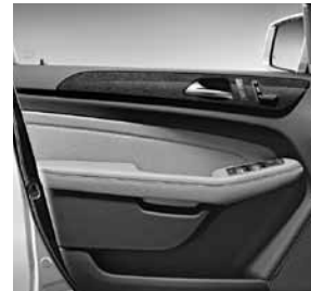
Zierelemente Holz Eukalyptus braun