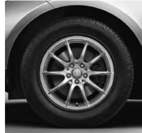
43,2 cm (17") Leichtmetallrädern im 10-Speichen-Design (25R)