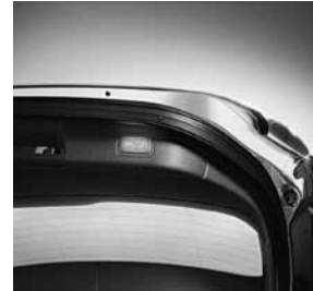
EASY-PACK-Heckklappe mit elektrischer Betätigung