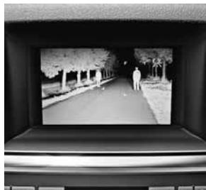
Nachtsicht-Assistent Plus mit Personenerkennung