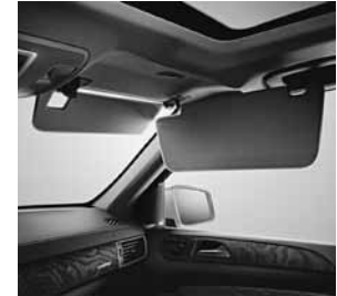
Doppelte Sonnenblende ausziehbar