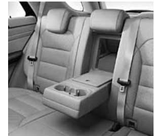
Durchlademöglichkeit über Armauflage im Fond