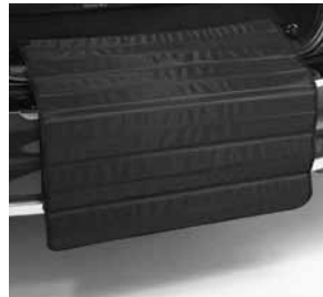
Zick-Zack-Ladekantenschutz (Abbildung ähnlich)