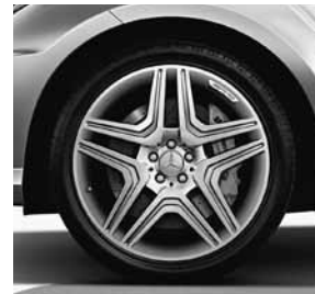
53,3 cm (21") Leichtmetallräder im 5-Doppelspeichen-Design (798)

ACHTUNG: NoVA, Kraftstoffverbrauch und CO 2 -Emission abhängig von Getriebeart und Reifendimension