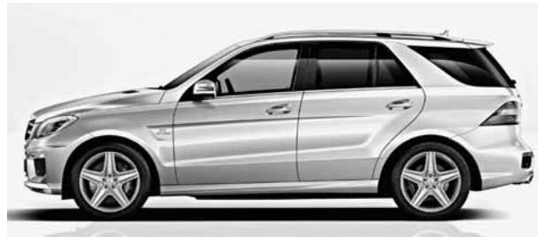
Seitenansicht ML 63 AMG