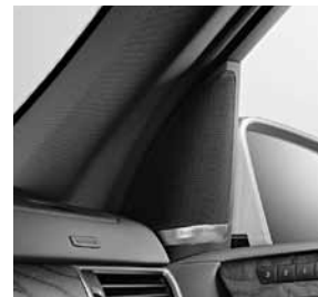
Harman Kardon® Logic 7® Surround-Soundsystem