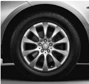
45,7 cm (18") Leichtmetallrädern im 10-Speichen-Design (R41)