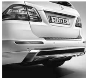
AMG Sportpaket Exterieur Heck