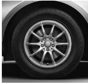
43,2 cm (17") Leichtmetallräder im 10-Speichen-Design (25R)