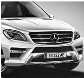
AMG Sportpaket Exterieur Front

ACHTUNG: NoVA, Kraftstoffverbrauch und CO 2 -Emission abhängig von Getriebeart und Reifendimension