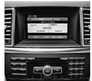
Audio 20 CD