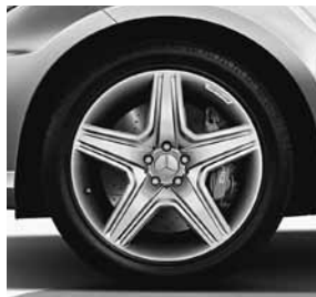
50,8 cm (20") AMG Leichtmetallräder im 5-Speichen-Design (778)