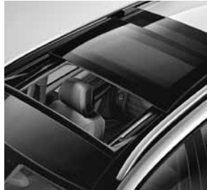
Panorama-Schiebedach elektrisch in Glasausführung