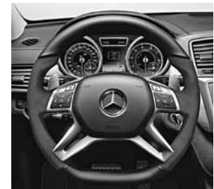
AMG Performance Lenkrad in schwarz mit Mikrofaser DINAMICA im Griffbereich