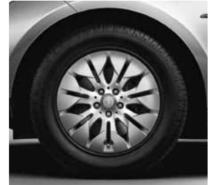
43,2 cm (17") Leichtmetallrädern im 7-Doppelspeichen-Design (R24)