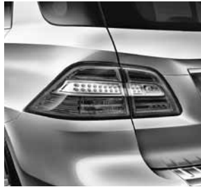
Heckleuchten in LED-Lichtleitertechnik