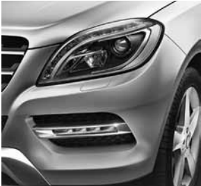
Lichtpaket inkl. Intelligent Light System