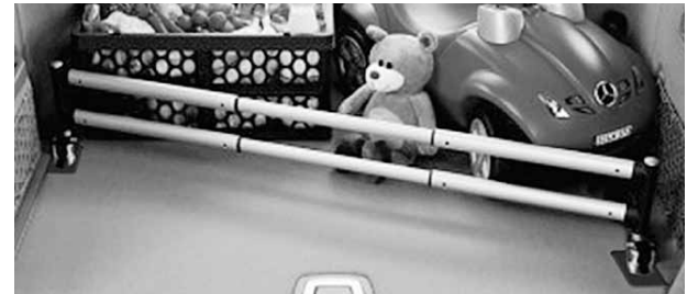
Steckmodul für Kofferraum