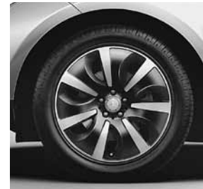
48,3 cm (19") Leichtmetallrädern im 7-Speichen-Design (06R)