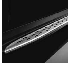
Trittbretter in Aluminium-Optik mit Gummipoppen