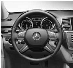
Multifunktionslenkrad als 4-Speichen-Lenkrad/Leder Nappa