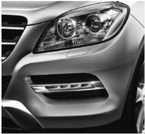
Scheinwerfer in Klarglas mit H7-Projektionstechnik