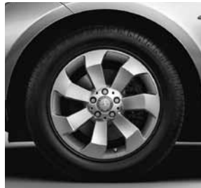
45,7 cm (18") Leichtmetallrädern im 7-Speichen-Design (03R)