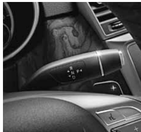
DIRECT SELECT-Schaltung mit Lenkradschaltpaddles