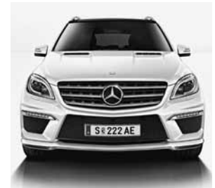
Frontansicht ML 63 AMG