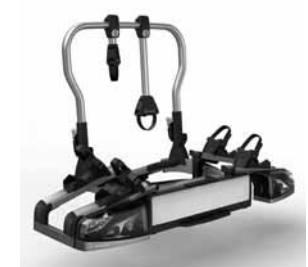
Heckfahrradträger für Anhängervorrichtung