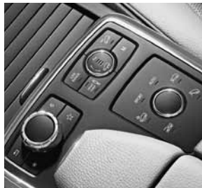
Controller auf Mittelkonsole und Bedienschalter AIRMATIC-Paket (SA) mit ON&OFFROAD-Paket (SA)