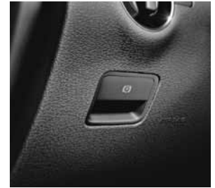
Feststellbremse elektrisch mit Komfortfunktion