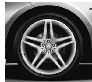
53,3 cm (21") AMG Leichtmetallrädern im 5-Doppelsp.-Design (757)