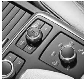
Bedienhalter AIRMATIC-Paket und ON&OFFROAD-Paket